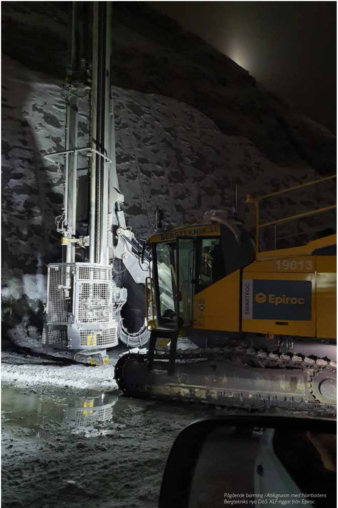
Pågående borrhning i Aitikgruvan med Norrbottens Bergtekniks nya D65 XLF-rigg från Epiroc